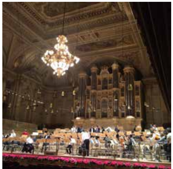
Vorprobe in der Tonhalle