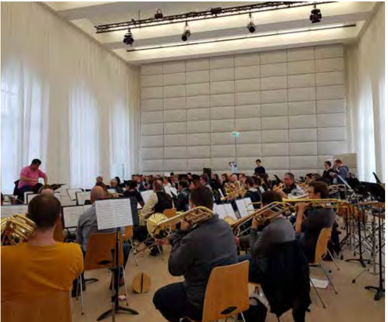
Voller Konzentration im wunderschönen, hellen Probesaal.